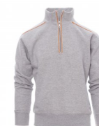
SIVÁ MELANŽOVÁ /ORANŽOVÁ