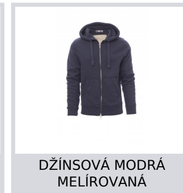
DŽÍNSOVÁ MODRÁ MELÍROVANÁ