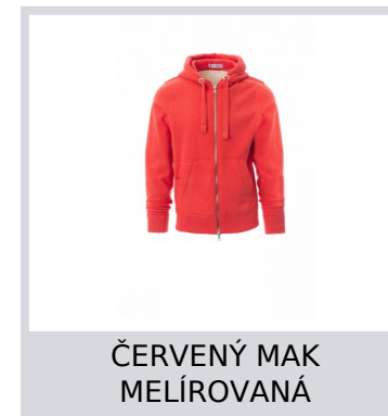
ČERVENÝ MAK MELÍROVANÁ