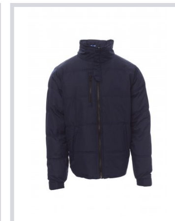
NÁMORNÍCKA DRESS BLUE