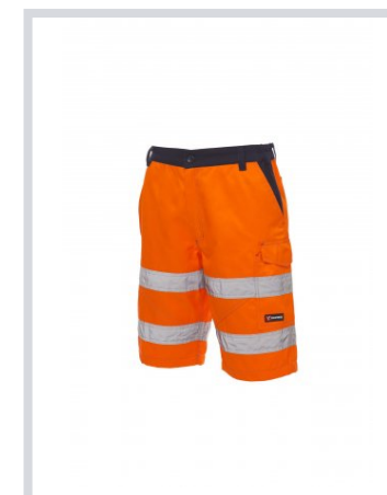
ORANŽOVÁ FLUO/NÁMORNÍCKA MODRÁ