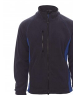
NÁMORNÍCKA MO DRÁ/KRÁĽOVSKÁ MODRÁ