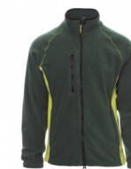
ZELENÁ/LIMETKO VÁ ZELENÁ